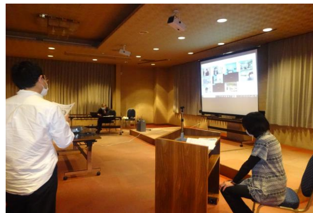
R2年度の多職種連携会議の様子

第2回・第3回については、「糖尿病」「ACP」等を検討中 会場参加、リモート参加を併用しての開催